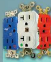
TOMAS ELÉCTRICAS tipo hospitalario