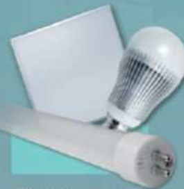
FOCOS DE LED para uso hospitalario