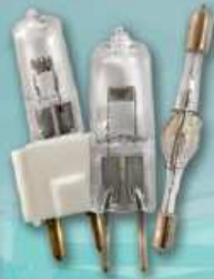
MICROSCOPIO Y LABORATORIO