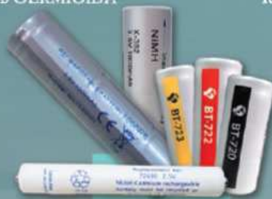
BATERÍAS RECARGABLES para estuche de diagnóstico